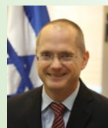
עודד פורר שר החקלאות