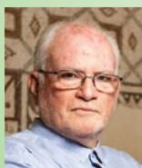
אלוף במיל' עמוס גלעד